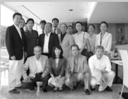
東京ドームホテルにて

東政連立川支部の「東政連の集い」は、平成9年7月8日に第1回をスタート。国会議事堂とレインポータウン（東京臨海副都心）の見学を皮切りに、毎年1回約40名から50名の参加者で開催されております。平成15年には重要文化財である旧岩崎邸、平成17年には旧島崎藤村邸、また、旧吉田茂邸、平成19年には鳩山会館など政治にかかわりの深い場所も訪問し、政治が身近なものに感じられる意義のある見学会となっています。