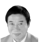
政務調査会長 三宅 しげき 58 宅建議連副会長 現職3期