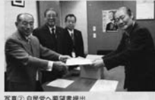
写真② 自民党へ要望書提出