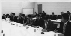
写真① 公明党へ要望書提出