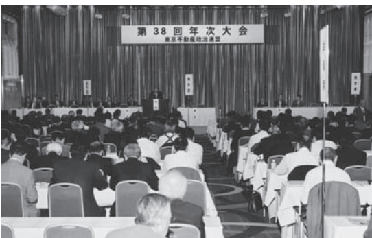
第38回年次大会（京王プラザホテルにて）