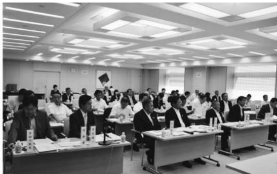
都議会自民党ヒアリング