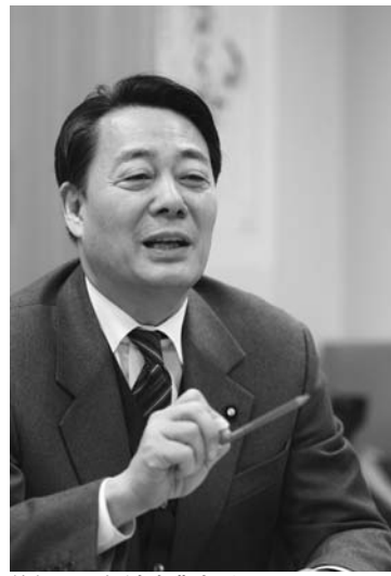
海江田元経済産業大臣