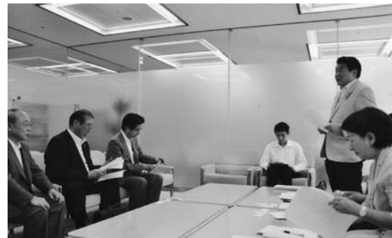
都議会公明党ヒアリング

れ要望事項を提出しました。 ■ 12月9日 賃借人の居住の安定を確保するための家賃債務保証業の業務の適正化及び家賃等の取立て行為の規制等に関する法律案」が、平成23年12月9日の衆議院国土交通委員会理事会上において「廃案」となりまし