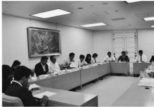
都議会民主党ヒアリング

■ 9月27日 都連所属国会議員並びに選挙区支部長出席のもと自民党本部にて、平成24年度国家予算を含めたヒアリングが開催さ