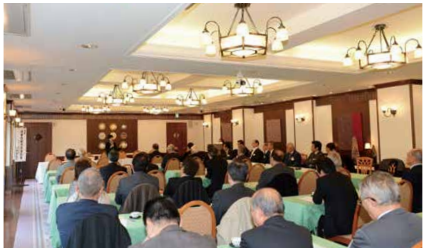
興味深いテーマに熱心に聞き入る参加者たち

路についての検討を参加者から求められ、法改正も視野にいたれた回答がなされました。