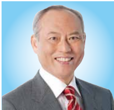
舩添 要一(ますぞえ よういち)氏

1948年 福岡県北九州市で生まれる／ 1971年 東京大学法学部政治学科卒業 ／2001～2007年 参議院議員／2007～ 2013年 参議院議員(当選2回目)／ 2007～2009年 厚生労働大臣／2010～ 2013年 新党改革 代表