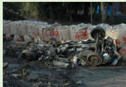
災害から2ヶ月余り経過しても、復旧が進まない状況が島内各所に見られる