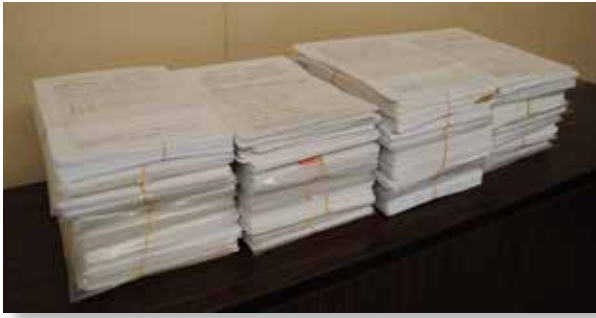
協会に寄せられた約6万名の署名

従来から提案してきた「宅地建物取引主任者」から「宅地建物取引士」への呼称変更実現のため、署名活動を平成25年10月20日より開始し、会員の皆様の協力のおかげで、約6万名の署名が集まりました（平成26年2月14日現在）。ご協力に感謝するとともに、一日も早い実現に向け、邁進して参ります。