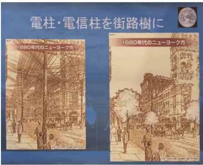
※電柱があることと無いことでこんなにも違う風景