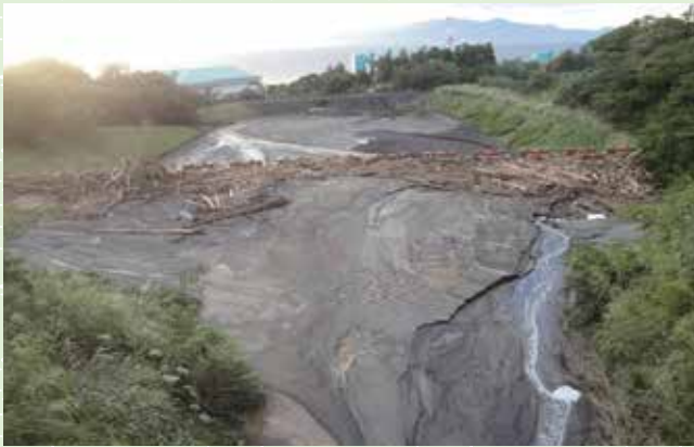
土石流が流れ込み、周りを覆い尽くした