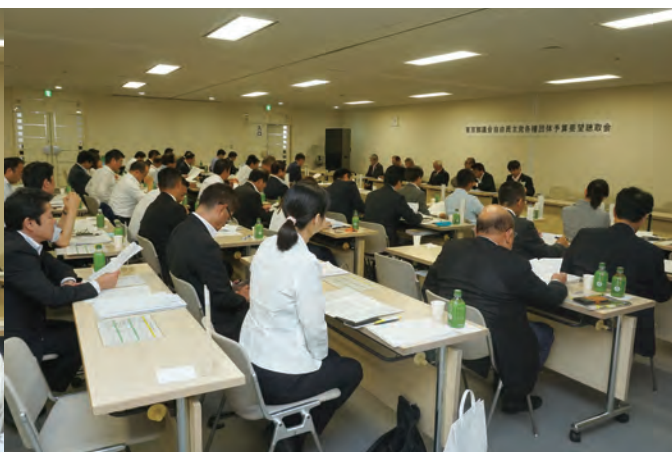
自由民主党の聴取会では約 40 人の議員が出席

平成 29 年 8 月 3 日および 9 月 4 日の 2 日間にわたり、平成 30 年度東京都議会予算要望聴取会が都庁議会棟にて行われました。