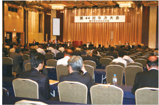
16時から京王プラザホテル5階「コンコードボールルーム」で開催された第44回年次大会